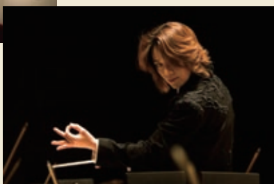
指揮者・西本 智実