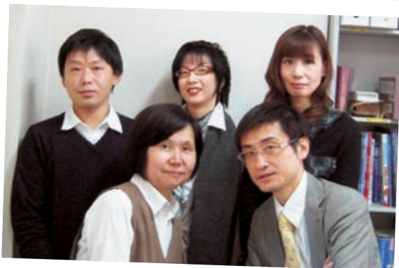
エクステンションセンター八丁堀校スタッフ